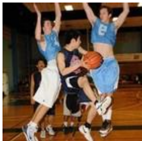
バスケットボール（男女）