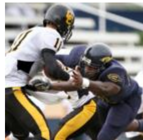
アメリカンフットボール