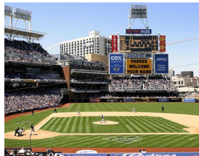
メジャーリーグ球場での体験